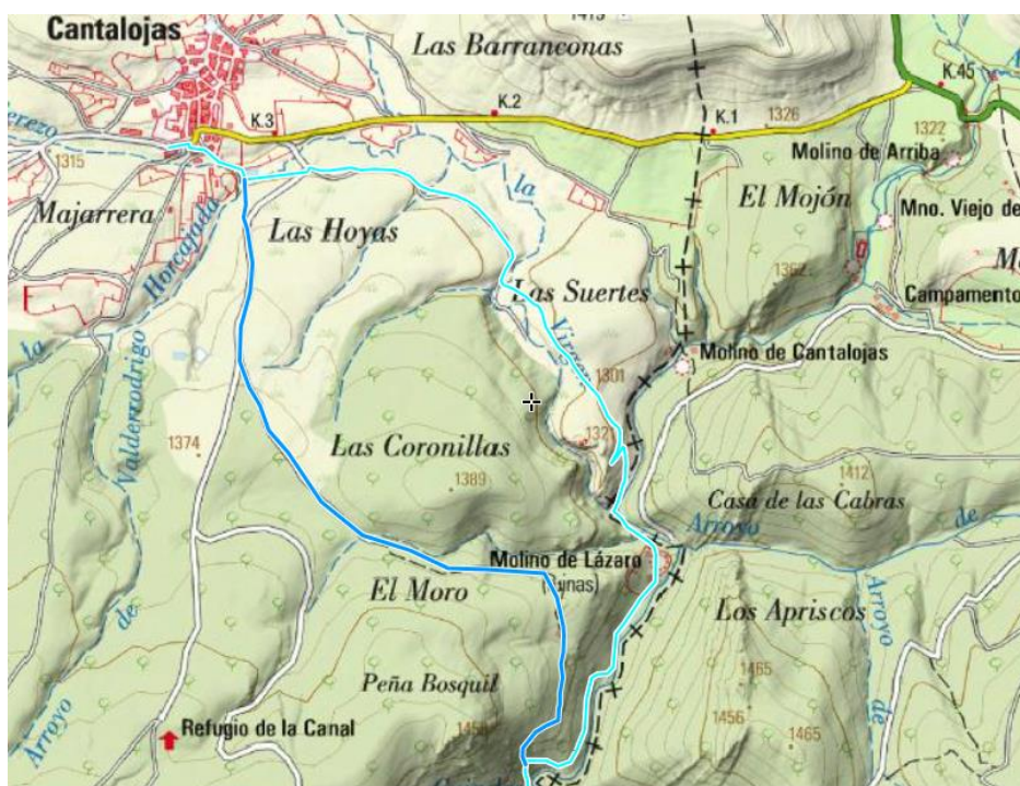
Trazado en azul oscuro Variante GR 167.2 de Cantalojas al río Sorbe.