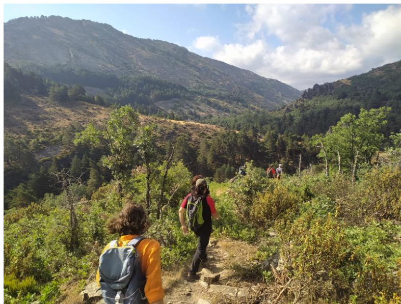
Descenso hacia el río Sorbe desde las Tainas de la Mata. GR 167.2 de Cantalojas.