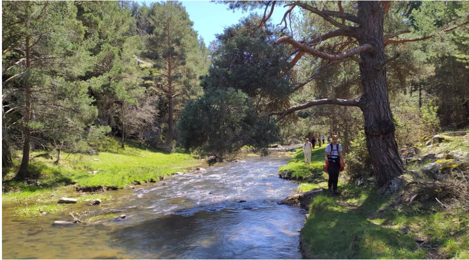
Sendero GR 167 ascendiendo junto al Sorbe hacia Cantalojas, la otra rivera es de Galve de Sorbe.

Continuación en ruta CIRCULAR por el final de la Etapa 2 del GR 167 hasta Cantalojas.