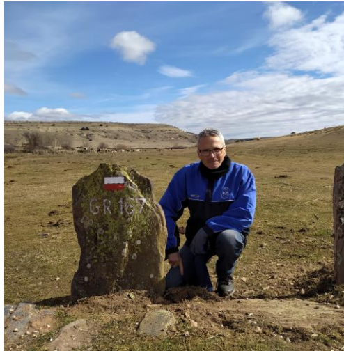
Logo del Voluntariado y señalización en el inicio de la Variante GR® 167.2 que parte de la pasarela de las Dehesillas.

Variante de sendero de gran recorrido GR 167.2 , que discurre por el municipio de Cantalojas, pueblo de la Sierra Norte de Guadalajara, en la Comunidad autónoma de Castilla-La Mancha, transitando por el valle del Sorbe, en el Macizo de Ayllón.