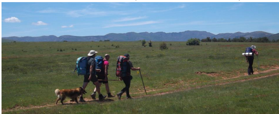
Praderas de Cantalojas en La Llana, Variante GR 167.2, al fondo la Sierra de la Buitrera, Hayedo de Tejera Negra.