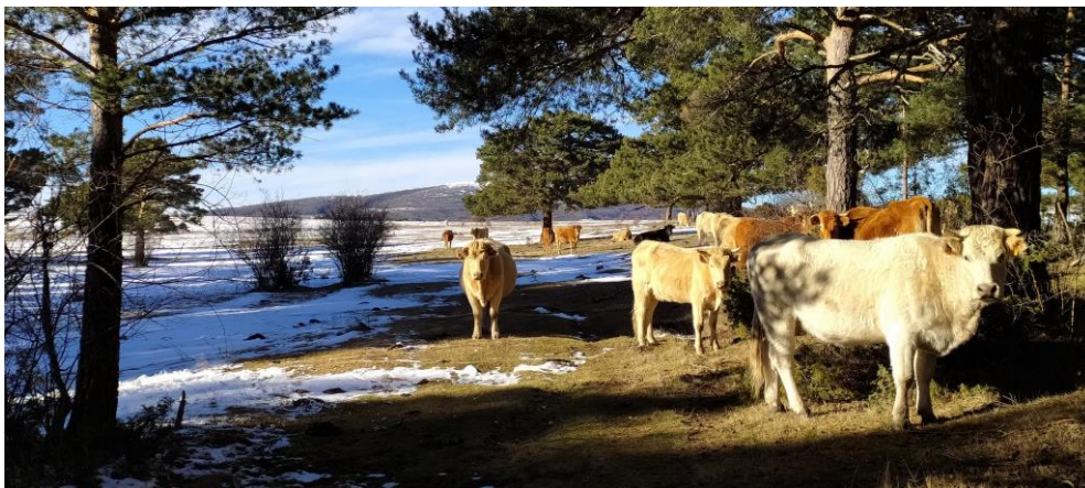
El camino entre Pozo Calderón y La Llana, límite entre el bosque y las praderas.