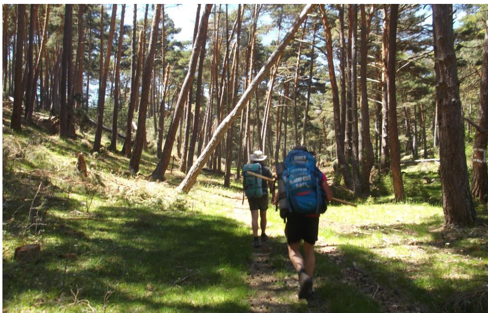
Sendero de la Variante GR 167.2 por el camino de Pozo Calderón hacia Cantalojas en el pinar.

Realizado por Club deportivo AZUANDARINES, el Voluntariado y con la colaboración del Parque Natural Sierra Norte de Guadalajara (JCCM).