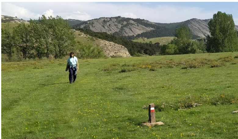
Caminando por las Dehesillas hacia Cantalojas, al fondo Valdicimbrio tras las rocas de la Barrera.

Desde el poste direccional que vemos en el fondo del valle, el sendero GR 167 asciende por el camino de sirga de la margen derecha, sin cruzar el río, por el lado de Cantalojas, el fondo del valle de aquí hasta el Molino de Cantalojas es plano, disputándose el Sorbe y las praderas de rivera, que en épocas de crecidas pueden llegar a inundarse y a ambos lados el bosque de pinos llega hasta las orillas, con la presencia frecuente de roquedos de cuarcita, el valle se abra un poco más llegando al Molino de la Malecilla o de Lázaro, donde pasamos sobre el y junto a su caz llegamos al vado del arroyo de la Horcajada y sus potentes acantilados, cuando la ladera se suaviza iniciamos el ascenso de la ladera del Castillo de los Moros o Diempures, pudiendo subir a sus ruinas para apreciar uno de los paisejes más impresionantes, continuamos hacia Cantalojas pasando el collado que nos lleva a Las Suertes, aquí el arroyo de la Horcajada deja espacio a un entorno de prados o suertes valladas con piedra, terminadas las cercas vadeamos el arroyo de nuevo para por las praderas abiertas de las Dehesillas encaminarnos al puente del arroyo y regresar a Cantalojas, en una ruta de 8,9 km . (2 horas 45 minutos de marcha).