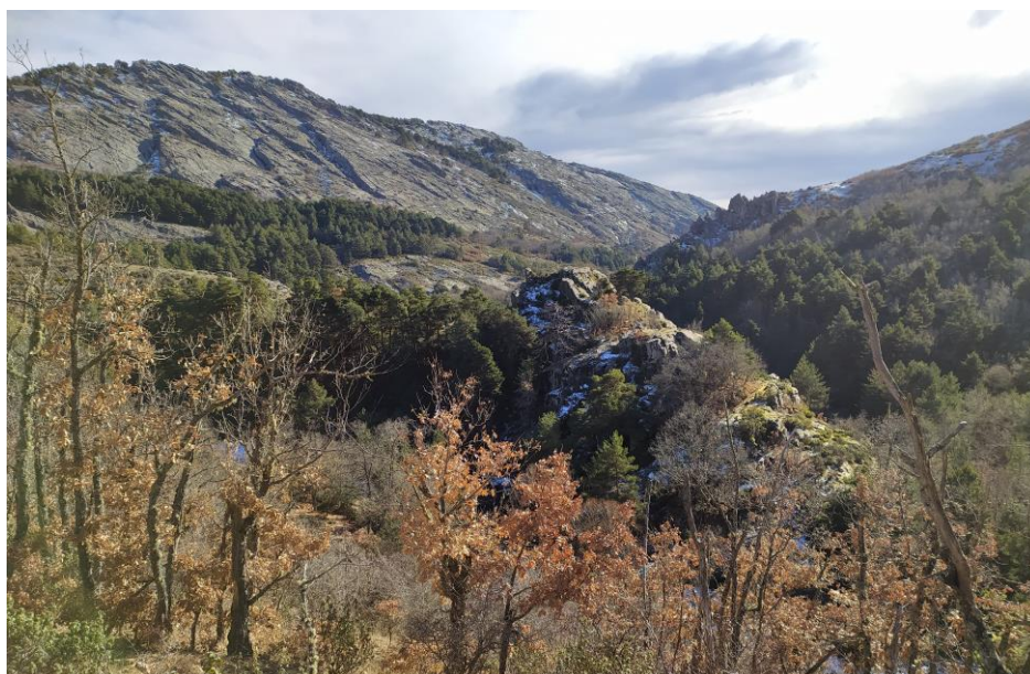
Robledal y pinar en el Sorbe desde la Variante GR 167.2 hacia la Vuelta de Pie Agustín y Peña del Osar (Galve).

Esta variante es la seguida desde Cantalojas para ir hacia Valverde de los Arroyos por la vereda del Sorbe, permite acortar 900 metros la ruta respecto al recorrido por el Castillo, pasa por el pinar hasta salir al valle por las tainas de la Mata y bajar al río Sorbe, enlazando con el recorrido principal del GR 167 pasado el arroyo de los Guindos, junto al Sorbe. Si avanzamos un poco más por la ruta principal hacia Pinillo nos asomamos al prado del collado frente a la Maleza Grande, lugar de hermosas vistas. La ruta principal va a Cantalojas río arriba, pasando junto al Molino de la Malecilla y bajo el Castillo de Diempures.